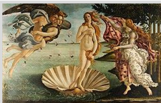
La naissance de Vénus de Botticelli