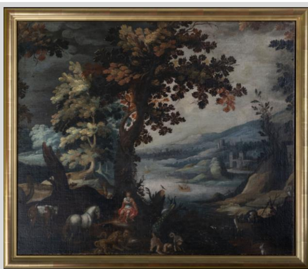
Orphée : © Musée barrois, Bar-le-Duc / M. Petit

Orphée charmant les animaux , Ecole flamande, XVII ème siècle