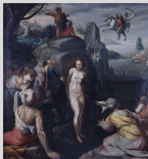
Persée : © Musée barrois, Bar-le-Duc

En haut à droite du tableau, on voit Persée chevauchant Pégase (cheval ailé). Il vient de tuer la Gorgone Méduse (femme aux cheveux serpents) de son sang est né Pégase. Sur le chemin du retour, il aperçoit une très belle jeune fille (Andromède) prête à être sacrifiée. Le héros en tombe amoureux et promet à ses parents de la sauver en échange de sa main, les parents acceptent. Selon les versions, Persée tue le monstre marin avec l'épée et le bouclier d'Athéna ou en le pétrifiant avec la tête de Méduse .